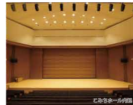
こみちホール内観

高層棟は、1階に図書室、講義室、事務室などがあり、2階から7階までは学部が使用する講義室や実習室、演習室、教員の研究室などがあります。また眺望の良い最上階の8階には食堂があり、蹊友会事務室である「蹊友会サロン」や会議室を併設しています。大阪市内を一望する眺めを堪能しながら、食堂での食事を楽しむことができます。