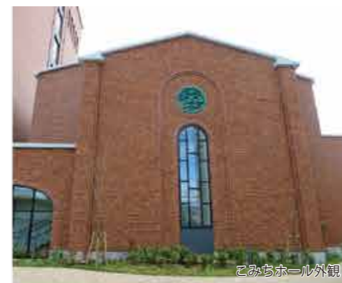
こみちホール外観

大阪成蹊大学の新キャンパス「相川駅前キャンパス」の新校舎がついに完成いたしました。新キャンパスの開設と同時に建設する新校舎は、8階建の鉄筋コンクリート造りで総床面積約10,000㎡の建物です。レンガを基調とした外観で、教室や研究室、食堂を擁する高層棟と大講義・各種イベント・コンサートの開催が可能な多目的ホール「こみちホール」を備えます。