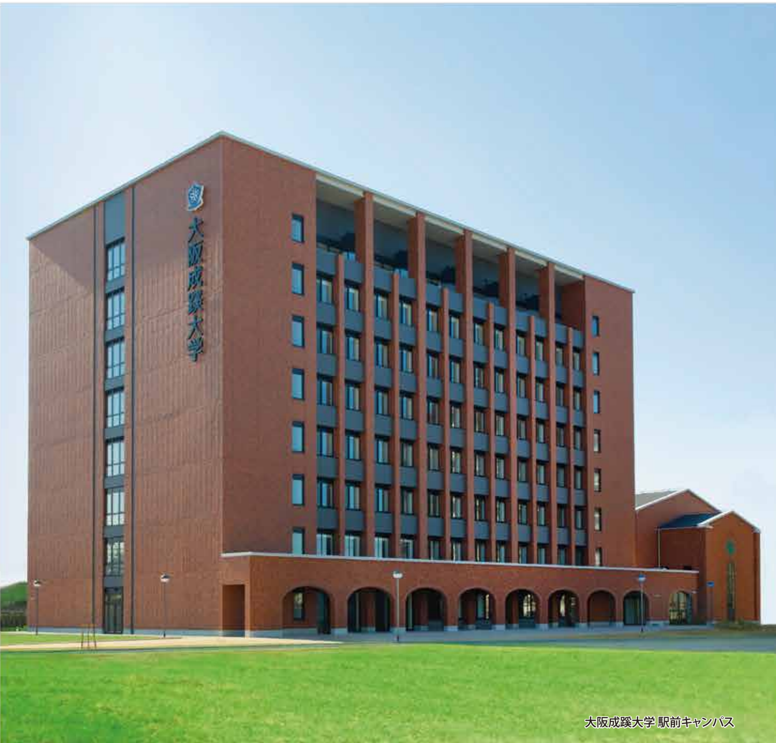
大阪成蹊大学 駅前キャンパス