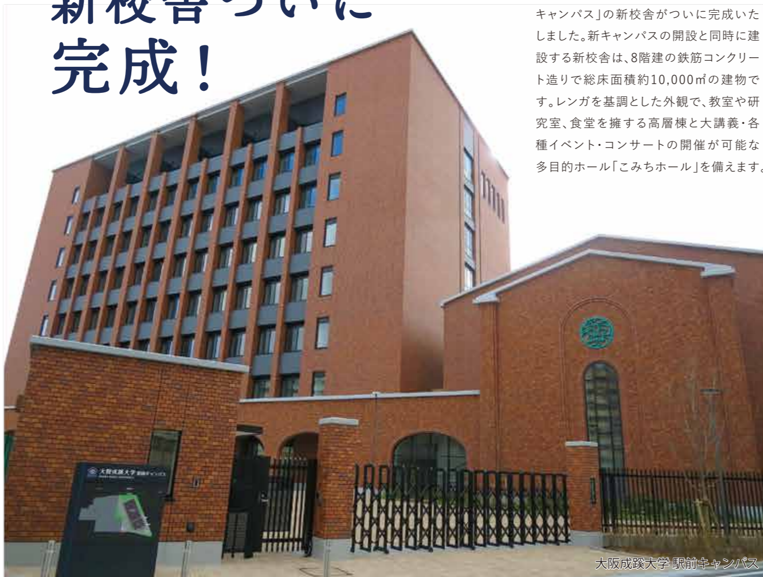
大阪成蹊大学 駅前キャンパス

大阪成蹊大学の新キャンパス「相川駅前キャンパス」の新校舎がついに完成いたしました。新キャンパスの開設と同時に建設する新校舎は、8階建の鉄筋コンクリート造りで総床面積約10,000㎡の建物です。レンガを基調とした外観で、教室や研究室、食堂を擁する高層棟と大講義・各種イベント・コンサートの開催が可能な多目的ホール「こみちホール」を備えます。